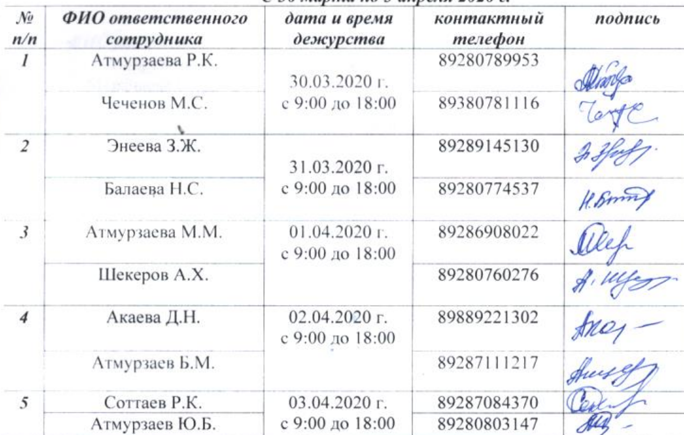
График дежурств работников МОУ СОШ №1 им. А.Ж. Доттуева с.п. Кенделен С 30 марта по 3 апреля 2020 г.